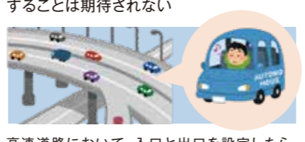
高速道路において、入口と出口を設定したら、あとは高速の出口付近まで、運転手は運転から解放される

限定領域内ですが、システムがすべての運転タスクを実施し、かつシステムによる作動継続が困難な場合、運転手が介入・応答することは期待されない