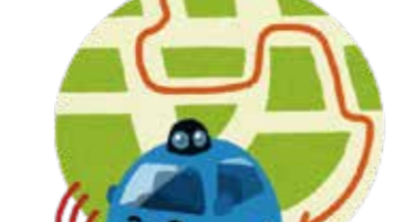
また、民事上の責任についても、前述したとおり、二つの事故について、運転者・保有者・販売店・メーカーなど複数の主体が賠償責任を負う余地が出てきます。この複数の賠償義務者がどのような関係に立つのか、いわゆる不真正連帯債務となるのか、その求償関係はどうなるのかなど、賠償責任保険の制度論も相まって、今後の立法的課題とされています。

いずれにしても、レベル④に相当する自動運転車が相当程度普及するまでには、法整備が求められることになると思いますので、今後も注目をしていきます。