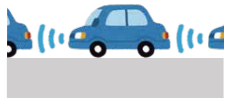
衝突被害軽減ブレーキやACC（アダプティブクルーズコントロール）【例：スバルのアイサイト】

システムが、「前後」「左右」いずれかの車両制御に係る運転タスクのサブタスクを実施する