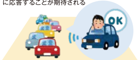
セカンドタスク（運転以外の作業）をしても良い【例：ホンダのレジェンド】

限定領域内では、システムがすべての運転タスクを実施してくれるが作動継続が困難な場合、運転手は、システムの介入要求に対して、適切に応答することが期待される