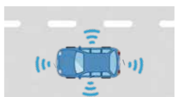
自動ステアリング操舵機能付きのACC【例：トヨタのミライ】

システムが、「前後」「左右」両方の車両制御に係る運転タスクのサブタスクを実施する